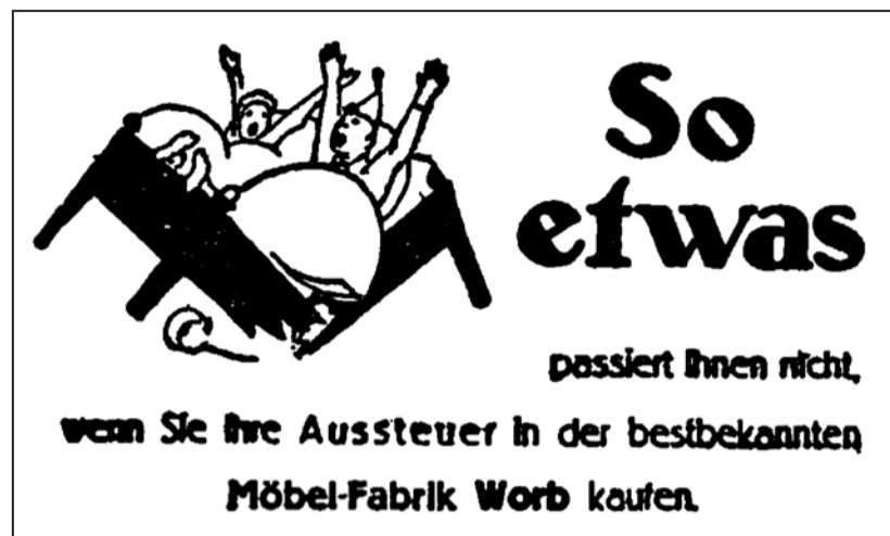
Reklame der Möbelfabrik von Ernst Schwaller im «Bund» vom 14. Dezember 1924. Das Worber Möbelhaus war während des ganzen Jahres mit originellen Inseraten im «Bund» präsent.

Das gesellschaftliche Leben wurde von den zahlreichen bürgerlichen und Arbeitervereinen gepflegt. Während des ganzen Jahres stellten diese Gesuche für Feste, besonders für Sommerfeste. Der Gemeinderat kam den einheimischen Gesuchstellern meistens entgegen, nicht so Auswärtigen. So lehnte er das Gesuch