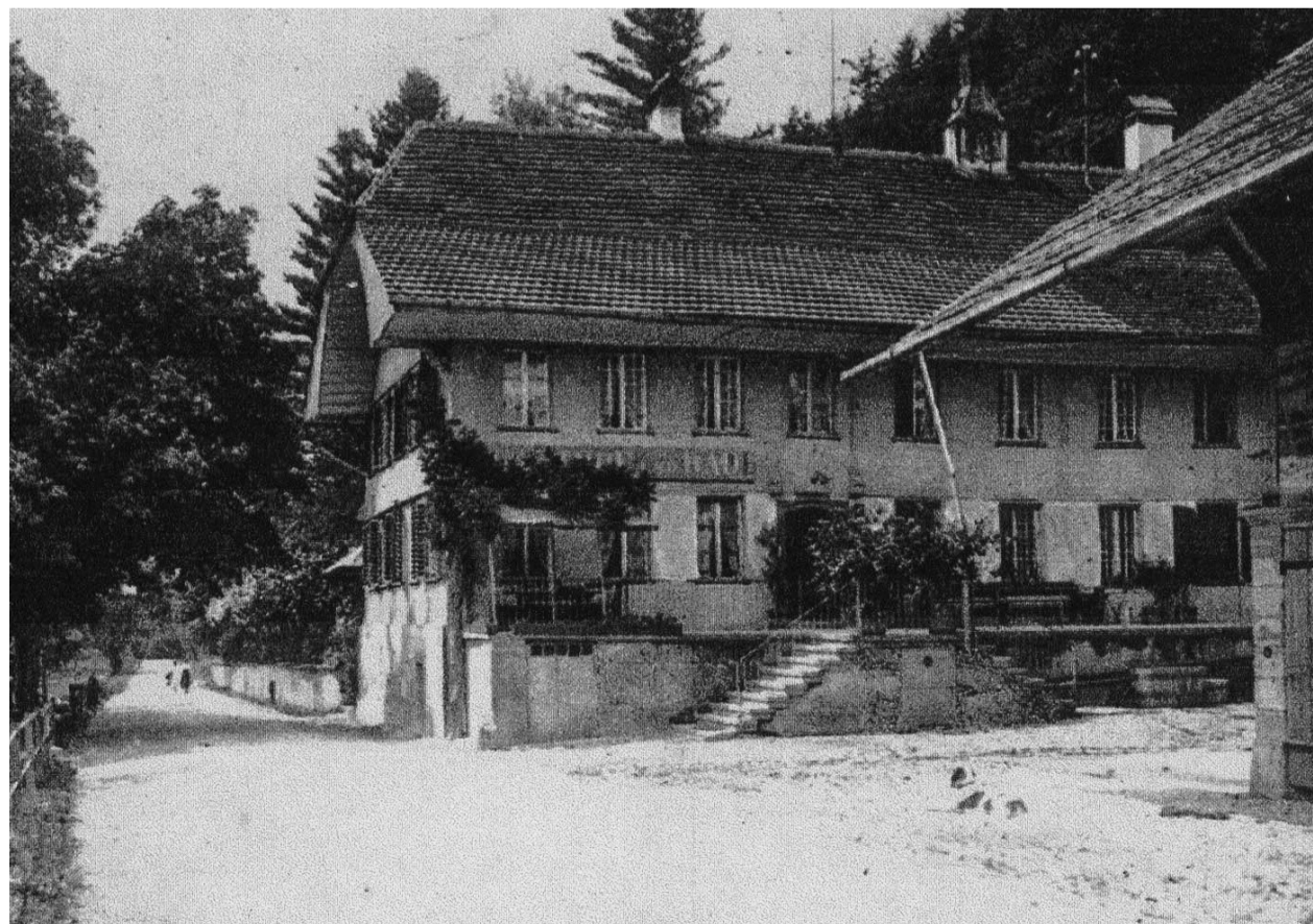
Bad Enggstein um 1920. Dieses wurde in der Stadtberner Presse als Ausflugsort beworben.

Streit mit dem Kanton gab es auch wegen der beginnenden Strassensignalisierung. Der Kanton setzte ohne Rücksprache mit der Gemeinde Tafeln für den Automobilverkehr und schickte unter Protest des Gemeinderats die Rechnung an die Gemeinde, die aber schliesslich bezahlte. Es formierte sich auch schon erster Widerstand gegen den noch schwachen Automobilverkehr. So verlangten die Anstösser der Wydenstrasse, dass der Automobilverkehr wegen den engen Raumverhältnissen und der Unfallgefahr durch ihre Strasse gänzlich verboten würde. Ende 1924 lag das Begehren immer noch beim Kanton. MARCO JORIO